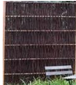
Heide (Jo) 120 x 100 cm 59,99 € 120 x 140 cm 69,99 € 120 x 180 cm 79,99 €