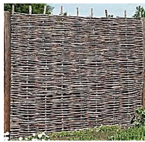
Haithabu (Jo) / Pablo (TJ) 180 x 90 cm 89,99 € (Jo) 180 x 120 cm 99,99 € (Jo) 180 x 150 cm 119,99 € (TJ) 180 x 180 cm 129,99 € (TJ) 90 x 180 cm 89,99 € (Jo)