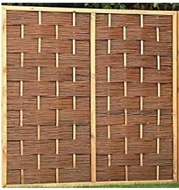
Hulteby (Jo) 120 x 180 cm 99,99 € 180 x 180 cm 159,99 €