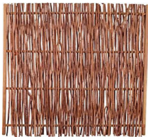
Pepe (TJ) 120 x 140 cm 139,99 € (28420) 120 x 180 cm 149,99 € (28421) 180 x 180 cm 169,99 € (28422)