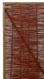
Weidetor (PI) ohne Beschlag 90 x 100 cm 75,00 € 90 x 140 cm 95,00 € 90 x 180 cm 105,00 € mit Beschlag 90 x 100 cm 128,00 € 90 x 140 cm 148,00 € 90 x 180 cm 158,00 €