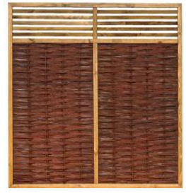
Rügen (Schm 5520/5510) 120 x 180 cm 109,95 € 180 x 180 cm 139,65 €