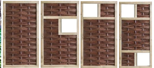
94 x 180 cm 149,99 €