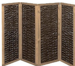
Paulina (TJ-36139/36137) 240 x 160 cm = 219,99 € 240 x 180 cm = 249,99 €