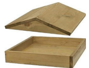
Vogelhaus 59,99 €