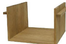
Regal seitl. offen 39,99 €