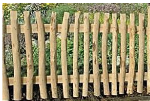
Altmark (Jo) 180 x 80 cm 99,99 € Altmark Steckbeetgrenze 120 x 15 cm 19,99 €