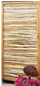
Hamarsund (Jo) Rahmen gebeizte Kiefer 40 x 45 mm 90 x 180 cm 119,99 € 120 x 180 cm 139,99 €