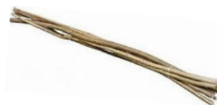
Haselnussruten (Jo) 1-3 x 180 cm 25 St./Bund 29,99 €