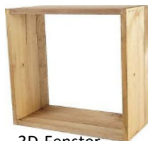
3D-Fenster 39,99 €