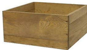
Pflanzkasten 49,99 €