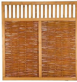
Vesuv (T&J-36165/36161) 120 x 180 cm 149,99 € 180 x 180 cm 199,99 €