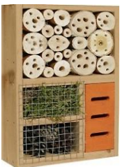
Insektenhaus 1+2 59,99 €