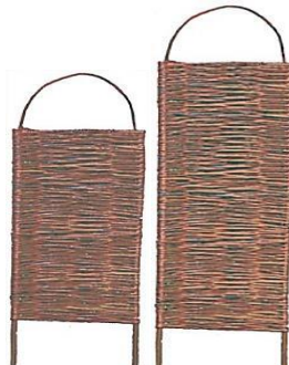
Alessia (TJ-36144/36143) 56 x 90/116 cm = 39,99 € 56 x 130/156 cm = 44,99 €