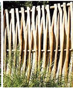
Paco (TJ) aus naturkrummen Halblatten 90 x 180 cm 129,99 € 150 x 180 cm 179,99 € 180 x 180 cm 249,99 €