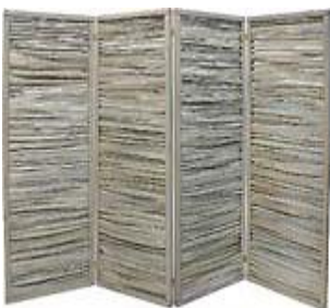
Esmeralda (TJ-28442) Füllung: gespaltene Haselnussstangen schiefergrau lasiert, Rahmen lasierte Kiefer 240 x 160 cm 279,99 €