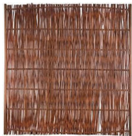
Fuego (TJ) / Hamdorf (Jo) 120 x 100 cm 54,99 € (Jo) 120 x 120 cm 64,99 € (TJ) 120 x 140 cm 64,99 € (Jo) 120 x 180 cm 79,99 € (TJ) 180 x 180 cm 129,99 € (TJ)