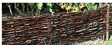
Weidensteckbeetgrenze (Jo) 120 x 20 cm 13,99 € 120 x 25 cm 15,99 €