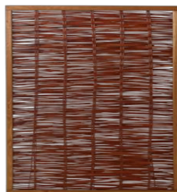
Fako (TJ) / Holm (Jo) 120 x 100 cm 59,99 € (Jo) 120 x 120 cm 79,99 € (TJ) 120 x 140 cm 69,99 € (Jo) 120 x 180 cm 79,99 € (Jo) 180 x 180 cm 129,99 € (Jo)