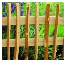
Rustik Haselnuss Steckbeetgrenze (Jo) 120 x 35/50 cm 21,99 €