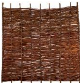
Aso (TJ) 180 x 90 cm 119,99 € 180 x 120 cm 119,99 € 180 x 150 cm 129,99 € 180 x 180 cm 139,99 €