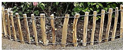
Rustik Haselnuss Rollbeetgrenze (Jo) Staketen Ø 20-40 mm 500 x 30 cm (LA 3-4 cm) = 64,95 € 500 x 50 cm (LA 3-4 cm) = 84,95 €