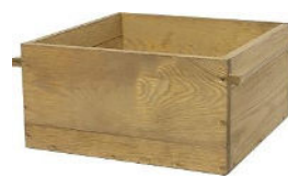
Regal 54,99 €