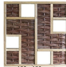
180 x 180 cm 36201 249,99 €