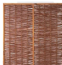
Fogo (TJ-36120) 180 x 180 cm 139,99 €