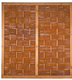
Ätna (T&J-36166/36162) 120 x 180 cm 99,99 € 180 x 180 cm 169,99 €