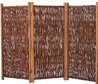
Sofia (TJ-36140) 180 x 120 cm = 139,99 € (3-tlg)