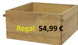
Regal 54,99 €