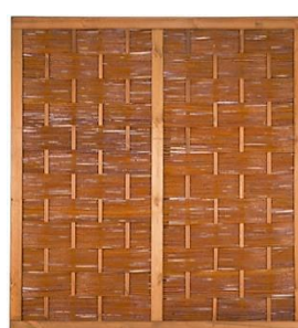
Ätna (T&J-36166/36162) 120 x 180 cm 149,99 € 180 x 180 cm 189,99 €