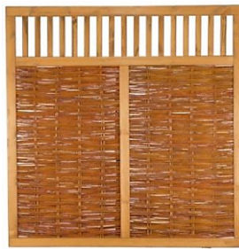
Vesuv (T&J-36165/36161) 120 x 180 cm 149,99 € 180 x 180 cm 189,99 €