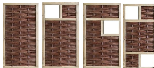
94 x 180 cm 149,99 €