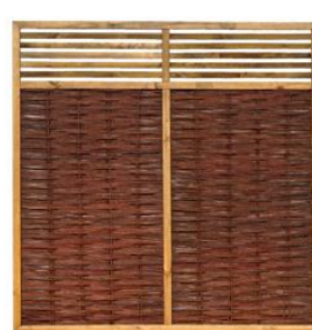
Rügen (Schm 5520/5510) 120 x 180 cm 109,95 € 180 x 180 cm 139,65 €