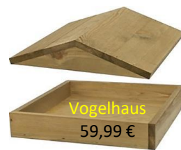
Vogelhaus 59,99 €