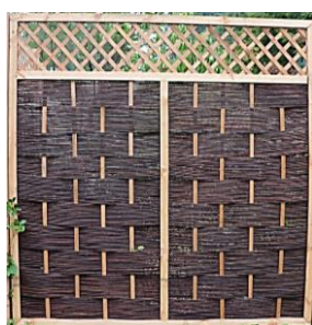
Hulteby mit Gitter (Jo) 120 x 180 cm 119,99 € 180 x 180 cm 169,99 €