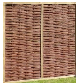
Halmstad (Jo) 180 x 180 cm 139,99 €