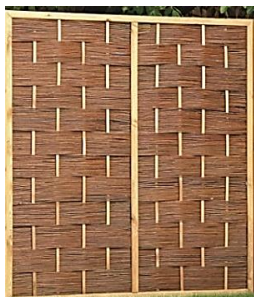
Hulteby (Jo) 120 x 180 cm 99,99 € 180 x 180 cm 149,99 €