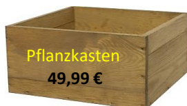
Pflanzkasten 49,99 €