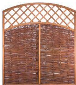
Dargo (T&J-36115) 180 x 180/200 cm 269,99 €