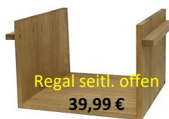
Regal seitl. offen 39,99 €