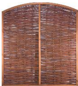
Nabro (T&J-36114) 180 x 180/200 cm 199,99 €